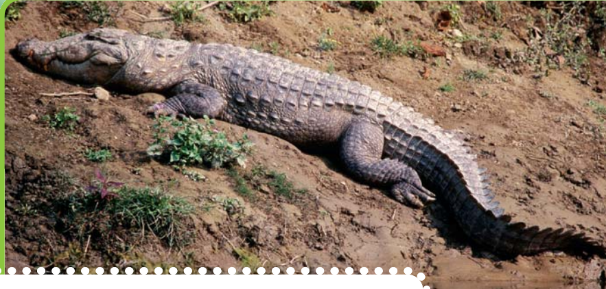
Güneşli Bir Yer

Balıklar, kaplumbağalar, kuşlar ve suda yaşayan memeli hayvanlar timsahın yemek listesinin başında gelir. Timsah pusu kurma taktiği ile avlanır. Pusudan sessiz sedasız avına yaklaşır ve avını yıldırım hızıyla kapar. Dilleri alt damağa bitişik ve hareketsiz olduğundan timsahlar avlarını çiğneyemezler. Çiğnemenen yutarlar. Büyük hayvanları ise yutmadan önce dişleri ile parçalarlar.