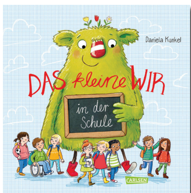
Das kleine WIR in der Schule Daniela Kunkel Carlsen Verlag 2018

Zu diesen Büchern gibt es Buchauszüge und Übungen in „Hallo Schule. Mein Buch“: