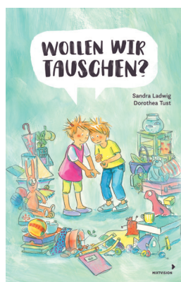
Wollen wir tauschen? Sandra Ladwig Illustriert von Dorothea Tust Mixtvision Verlag 2019

Ohne das WIR wäre alles grau und ohne Spaß. Wo überall steckt das WIR? In einfachen Doppelseiten zeigt das Buch, wie das WIR aus den Kindern einer Klasse eine Gemeinschaft macht.