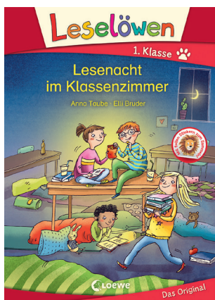
Leselöwen 1. Klasse Lesenacht im Klassenzimmer Anna Taube Illustriert von Elli Bruder Loewe Verlag 2019

Weihnachten? Was mag das nun wieder sein? Igel ist ein Ast auf den Kopf gefallen und deshalb hat er vergessen, dass es höchste Zeit für seinen Winterschlaf ist. Da kann nur dieses Weihnachten helfen, von dem Igel geschwärmt hat.