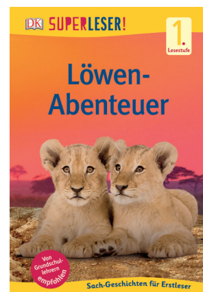
Löwen-Abenteuer Dorling Kindersley Verlag 2019

Paul ist aufgeregt: Heute ist Lesenacht in der Schule! Alle haben Schlafsäcke und Bücher dabei. Es gibt eine Schnitzeljagd und sogar Pizza. Aber was, wenn jemand ein bisschen Heimweh bekommt? Zum Glück sind alle Freunde da. Und am nächsten Morgen steht fest, dass die Lesenacht spitze war!