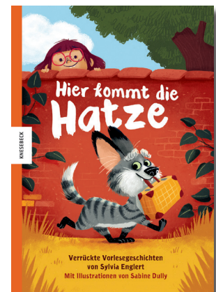
Sylvia Englert Hier kommt die Hatze Illustriert von Sabine Dully Knesebeck Verlag 2019

Die kleine Katze Missi Moppel hat einiges zu tun, um die kniffligsten Fälle aufzuklären und ist unglaublichen Rätselhaftigkeiten auf der Spur. Stets ist sie nur einen Katzensprung von der Lösung entfernt!