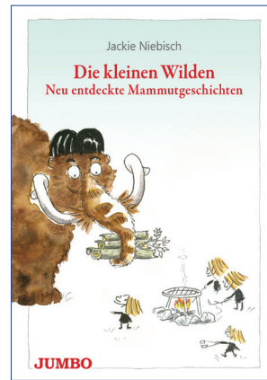
Jackie Niebisch Die kleinen Wilden. Neu entdeckte Mammutgeschichten JUMBO Verlag 2019