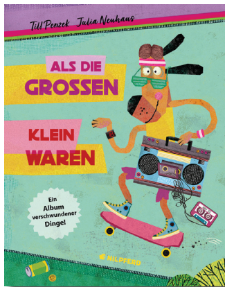
Till Penzek Als die Großen klein waren Illustriert von Julia Neuhaus NILPFERD Verlag 2019